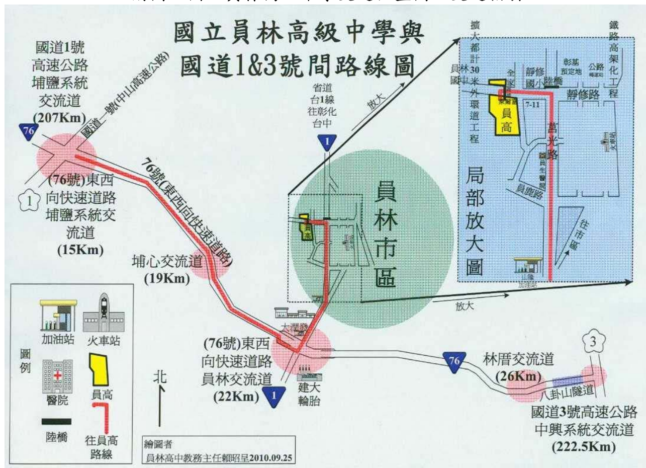
附圖、國立員林高級中學交通位置圖及交通指引